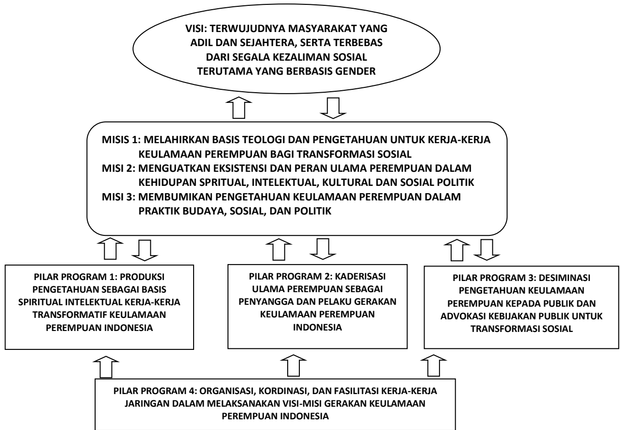
Diagram Visi, Misi, dan Program Strategis